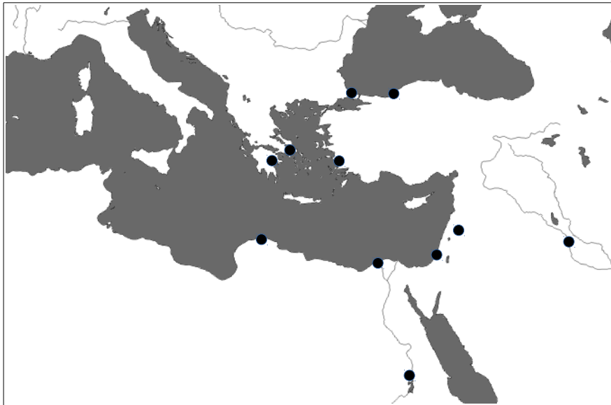
Empire grec d'Alexandre Le Grand

A cette époque, l'empire grecque est très étendu et cette civilisation est dominante dans de nombreux domaines, comme la philosophie, l'art, la littérature les sciences ou la politique. On parle de l'âge d'or de la civilisation grecque.